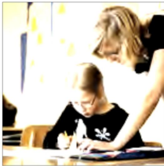
▲ Ob hilfsbedürftig oder leistungsstark: Individuelle Förderung ist ein Markenzeichen katholischer Schulen.